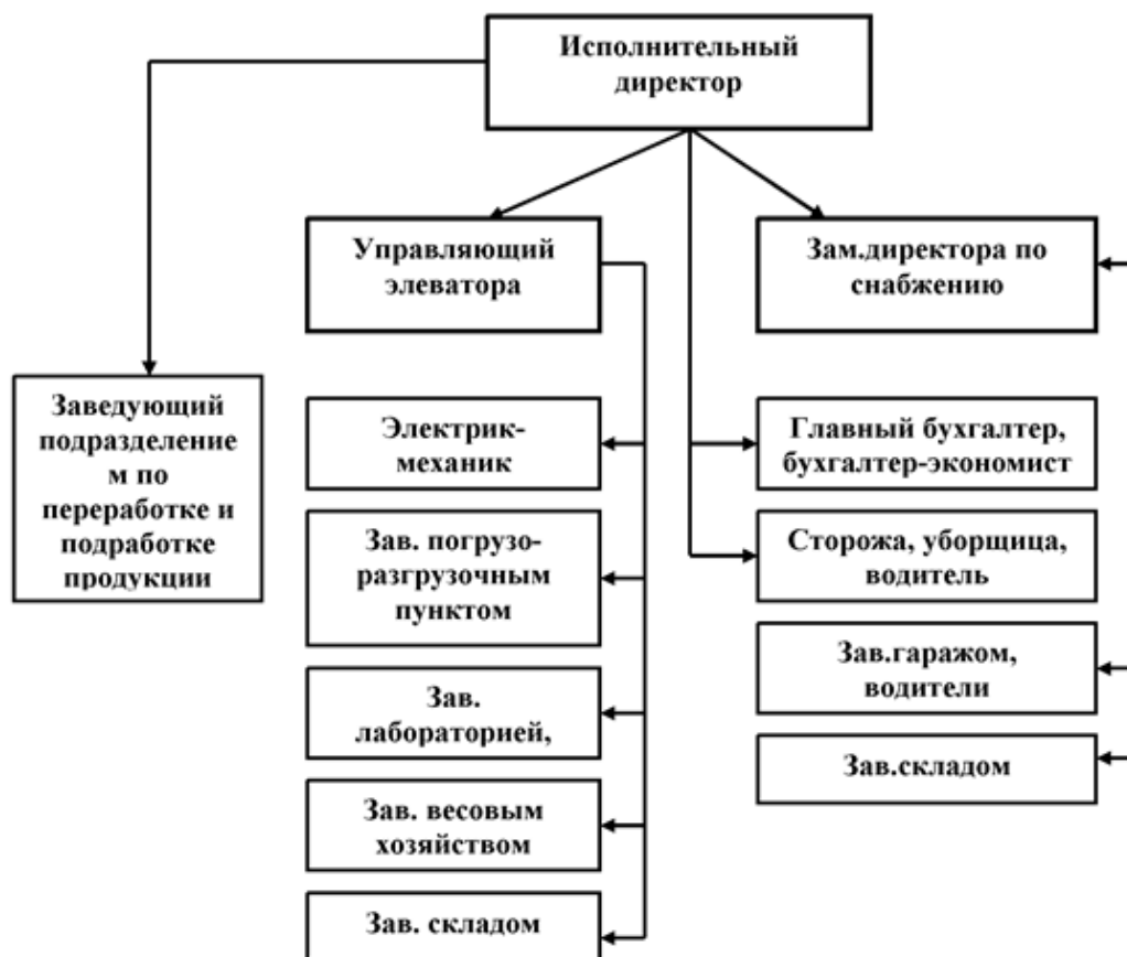
Рисунок 2 - Примерная организационно-управленческая структура исполнительной дирекции сельскохозяйственного потребительского снабженческо-сбытового кооператива

Деятельность каждой службы регламентируется должностной инструкцией, соответствующей требованиям внутреннего регламента кооператива. Кооператив отвечает по своим обязательствам всем принадлежащим ему имуществом и не отвечает по обязательствам членов кооператива. Убытки кооператива, полученные по вине члена кооператива, покрываются за его счет и в первую очередь возмещаются за счет паевого взноса этого члена. Члены кооператива несут солидарно субсидиарную ответственность по его обязательствам в пределах невнесенной части дополнительного взноса каждого из членов кооператива.